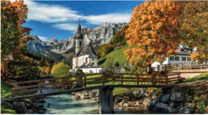
W-SS91 Paisajes Internacionales