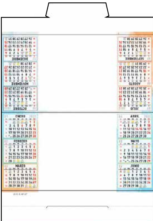
W-SS97 Sin foto (para personalizar) W-SS102 Sin foto (para personalizar en CATALÁN)