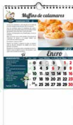
L-42 Recetas Pescados