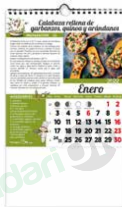
L-40 Recetas Verduras