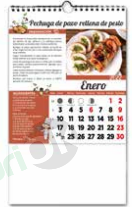
L-41 Recetas Carnes