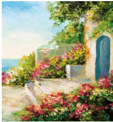
L-3255 Casa cerca del mar Arte SILVIA MALIVANI

RECUERDA! Todas las imágenes se adaptan a la proporción del tipo de calendario que se pida por lo que puede ser que de la imagen que ves en el catálogo se descarten márgenes.