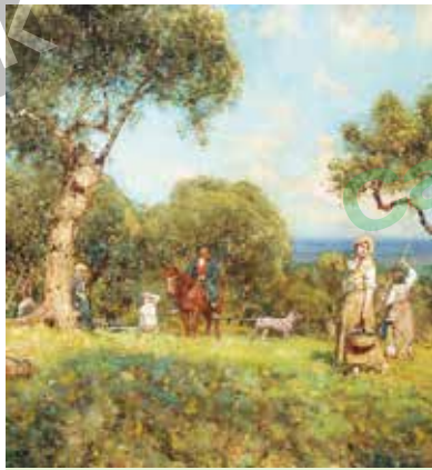
L-3256 Cosechando aceitunas Arte FRANCESCO PAOLO MICHETTI