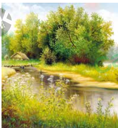
L-3259 Lago en verano Arte NODFF